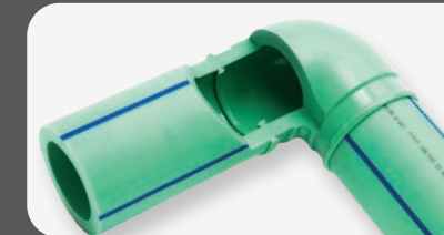
TOPO A TOPO Ø 160-400 mm