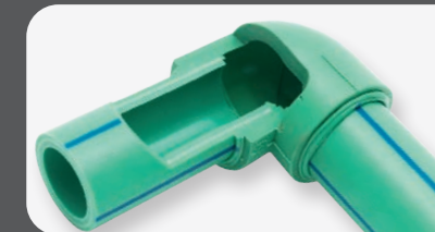
TERMOFUSÃO Ø 20-125 mm

O tubo PP-RCT 125 + FV SDR 11 é compatível com os seguintes tipos de soldadura: